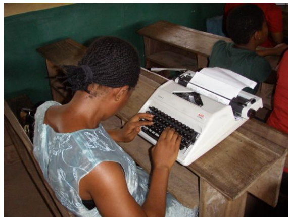
Blinde Studenten beim Schreiben auf der mechanischen Schreibmaschine